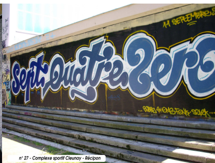
n° 27 - Complexe sportif Cleunoy - Récipon