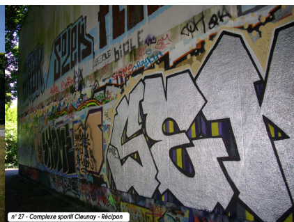
n° 27 - Complexe sportif Cleunoy - Récipon