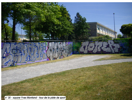
n° 35 - square Yves Montand - tour de la piste de sport